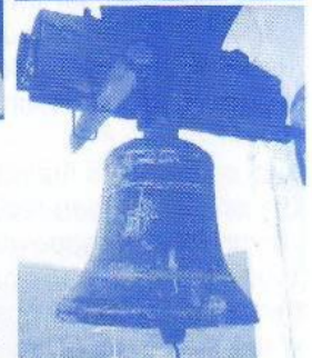
L'église de Mauvezin et les cloches qui datent de 1644 et 1662.