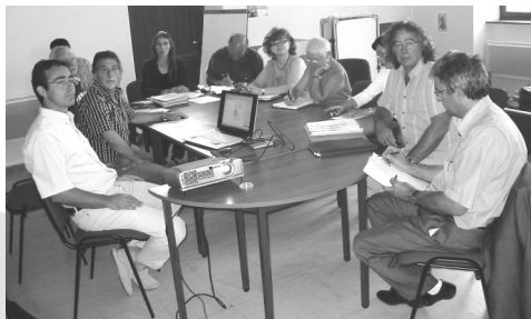
Réunion de travail avec les architectes, les élus et les partenaires de l'opérations.

En ce qui concerne le calendrier, les travaux devraient démarrer en 2007, pour une ouverture prévisionnelle des locaux, fin 2008-début 2009.