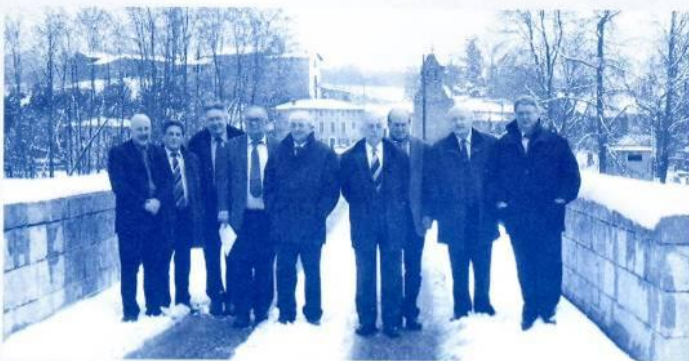
Les Conseillers Généraux de l'Ariège et de la Haute-Garonne se sont retrouvés cet hiver à Lacave pour présenter l'avancement de la 2x2 voies dans les deux départements.

Pour la suite, les conseils généraux conjuguent en ce moment leurs efforts sur deux autres portions. En ce qui concerne l'Ariège, il s'agit de la partie Prat-Bonrepaux-Lacave, et pour la Haute-Garonne, la partie Lacave-Mane. D'ici-2009, les deux départements espèrent venir à bout de toutes les démarches légales (études, déclaration d'utilité publique, acquisition des terrains, marché...) afin d'engager les travaux vers 2009-2010 et parvenir à joindre les deux bouts en 2012. Et bien sûr mettre en service l'ensemble de ces portions. Si tout se passe comme prévu, la 2x2 voies en 2012 devrait ainsi proposer 12 km de tracé continu entre Caumont et Mane. Sans compter qu'en 2008, le Conseil Général de l'Ariège compte bien réaliser le giratoire à Saint-Lizier, au niveau du croisement en direction du centre hospitalier Ariège Couserans.