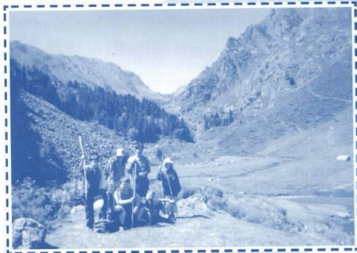
Randonnée et sports d'aventure pour les adolescents.