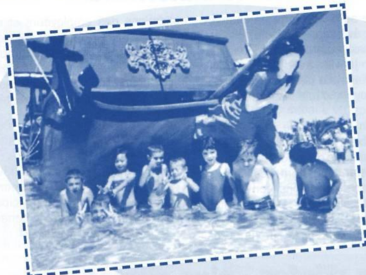
Séjour à Port-Leucate : plage, Aqualand et balade en petit train au programme.