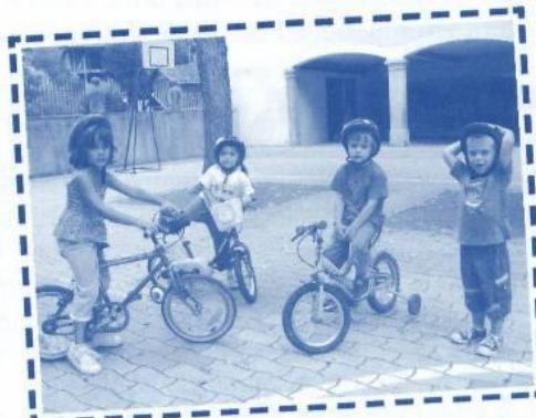
Du vélo pour les maternels dans la cour de l'école de Prat-Bonrepaux.