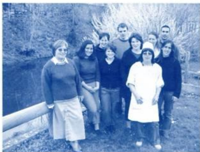
L'équipe du service animation

La Communauté de Communes a ensuite complété la formation de ce personnel en leur faisant obtenir un BAFD (Brevet d'Aptitude aux Fonctions de Directeur), et un BEATEP (Brevet d'État d'Animateur Technicien de l'Éducation Populaire) à la coordonnatrice. Aujourd'hui certains d'entre eux sont stagiaires, d'autres sont déjà titulaires, et appartiennent donc à la fonction publique territoriale. Dans cette démarche, la Communauté de Communes s'est investie pour les jeunes en créant ce service éducatif important pour les enfants. Mais il a aussi permis à des jeunes de se former et d'exercer un travail dans le Couserans qui correspondait à leurs aspirations.